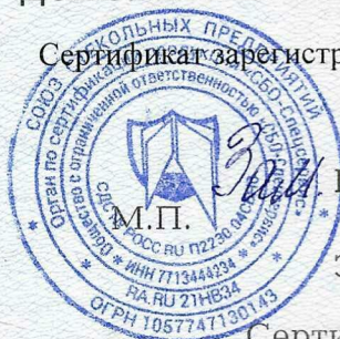
Схема сертификации: 2с

Сертификат зарегистрирован на сайте СДС № РОСС RU.П2230.04СБН0 www.sbosp.ru